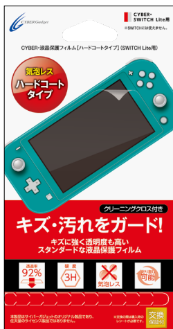
CYBER・液晶保護フィルム [ハードコートタイプ] (SWITCH Lite用)