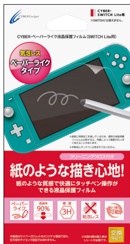
CYBER・ペーパーライク 液晶保護フィルム (SWITCH Lite用)