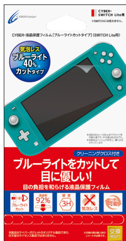
CYBER・液晶保護フィルム [ブルーライトカットタイプ] (SWITCH Lite用)