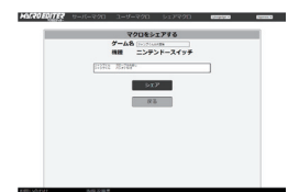
『アーケードフリーク』のシェアマクロ機能

マクロエディターには「シェアマクロ」機能が搭載されており、自分で作成したマクロ（ユーザーマクロ）のアップロードや、他のユーザーが作成したマクロのダウンロードが可能です。