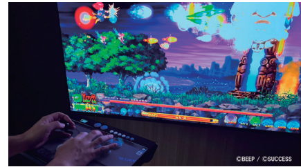
『アーケードフリーク』でSwitch版『コットンリポート』をプレイ

『ストリートファイター6』『鉄拳8』などの最新格闘ゲームから、『餓狼伝説2』などのレトロ格ゲー、『ダライアス』などの2Dシューティングゲーム、『テトリス』などのパズルゲームまで、多数のタイトルに1台で対応できます。