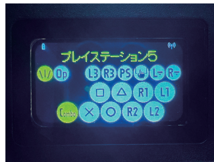
液晶画面に表示されたボタン配置