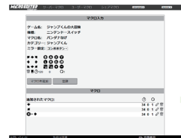
『アーケードフリーク』のマクロエディター

また、当社が作成した「サーバーマクロ」の内容を確認したり、「シェアマクロ」機能で他のユーザーが作成した「ユーザーマクロ」をダウンロードすることもできます。