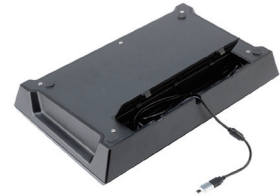
本体底面にケーブルを収納可能