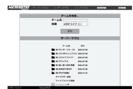
メガドライブミニ2用『餓狼伝説2』サーバーマクロ

マクロエディターでは、当社が作成した様々なタイトルのマクロ「サーバーマクロ」をご確認いただけます。サーバーマクロは『アーケードフリーク』本体の液晶画面上で選択可能。お好みのマクロを選ぶだけで使用できます。画像はメガドライブミニ2用『餓狼伝説2』（画面上では『ガロウ伝説2』と表示）のサーバーマクロで、キャラクター追加・ディップスイッチ追加・各種攻撃コマンドなどのマクロが含まれています。