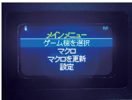
『アーケードフリーク』の液晶画面 メインメニュー

『アーケードフリーク』には液晶画面が搭載されており、画面上で簡単にゲーム機を選択できます。ゲームプレイ中の液晶画面には、選択中のプラットフォームに応じたボタン配置が常に表示されます。さらに、液晶画面から直接システムアップデートが可能。パソコンやスマートフォンを使う必要がありません。また、Wi-Fi設定や言語設定など、その他の設定も液晶画面で変更できます。